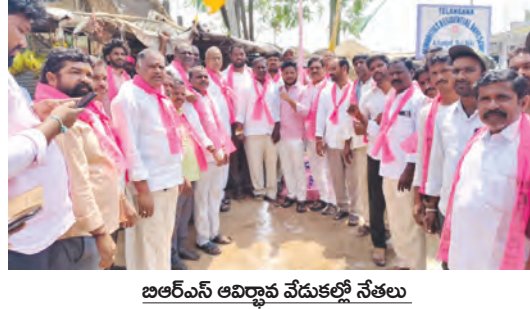
బిఆర్ఎస్ ఆవిర్భావ వేడుకల్లో నేతలు