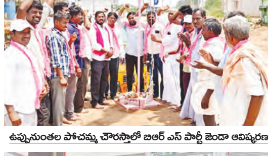
ఉప్పునుంతుల పోలవరం చౌరస్తాలో బిఆర్ ఎస్ పార్టీ జెండా ఆవిష్కరణ