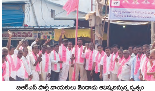
బిఆర్ఎస్ పార్టీ నాయకులు జెండాను ఆవిష్కరిస్తున్న దృశ్యం