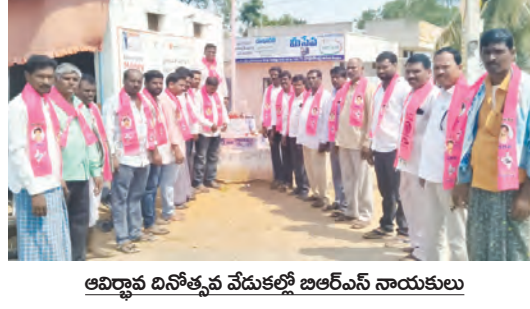
అధ్యక్ష వేడుకల్లో బిఆర్ఎస్ నాయకులు