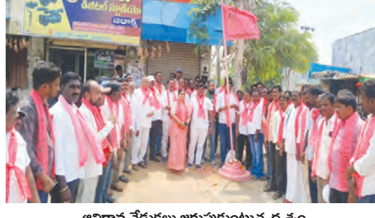
అధ్యక్ష వేడుకలు జరుపుకుంటున్న దృశ్యం