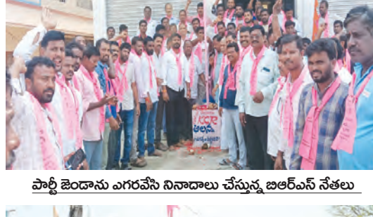
పార్టీ జెండాను ఎగురవేసి నివాసాలు చేస్తున్న బిఆర్ఎస్ నేతలు