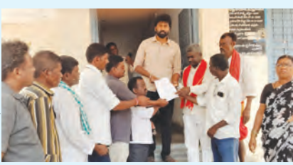
ఎంపీడీవోకు వినతి పత్రం అందజేస్తున్న దృశ్యం