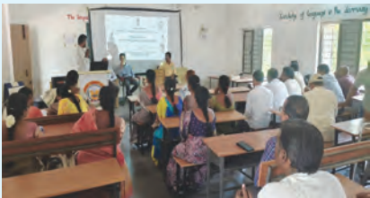
జనగణకులకు శిక్షణ ఇస్తున్న అధికారులు