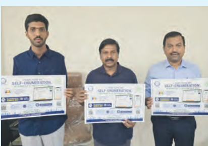
స్వీయ గణన కార్యక్రమం ప్రారంభమవుతున్న దృశ్యం